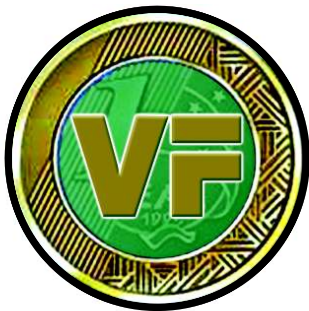
Marca em 100%